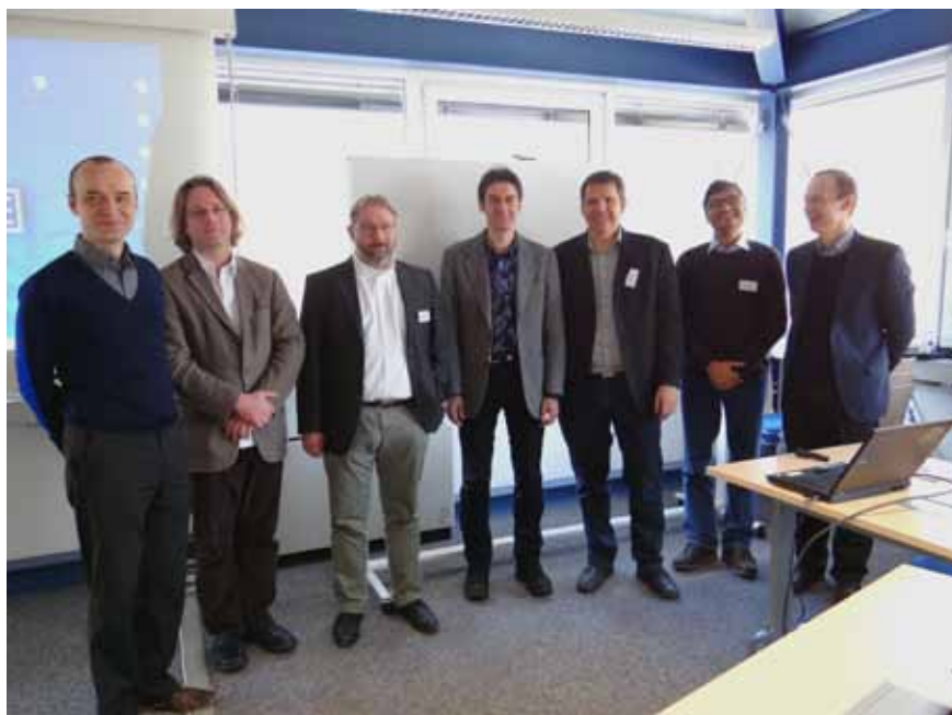
Die Teilnehmer des Workshops, der sich mit „Schicksal, Freiheit und Prognose in indischen Traditionen“ beschäftigte.

beschrieben, die darauf hindeuten, dass ein bestimmtes, meist unheilvolles Ereignis, eintreten wird, die es also in gewissem Rahmen erlauben, das Schicksal vorauszusagen. In seinem methodologisch orientierten Beitrag erläuterte Oliver Hellwig (Univ. Heidelberg), u. a. anhand des Mahābhārata , wie sich eine computergestützte