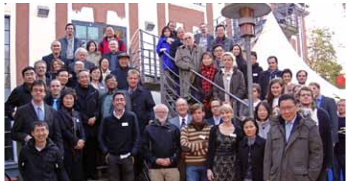
Teilnehmer und Besucher der Konferenz.