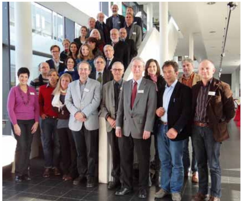
Die Teilnehmerinnen und Teilnehmer der Konferenz am Tagungsort, dem Zentrum für Medizinische Physik und Technik, Universität Erlangen.