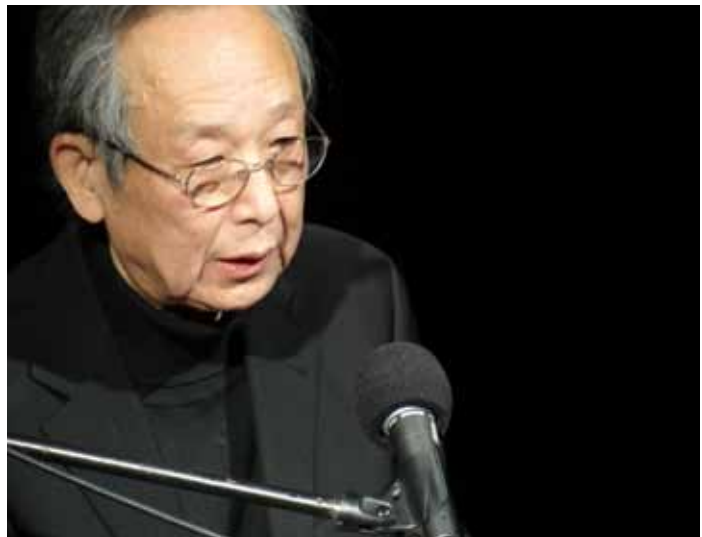
Gao Xingjian während seiner Eröffnungsansprache.

Die Bedeutung, die Gao der Freiheit zuspricht, erklärt sich nicht zuletzt aus seiner Biographie: Gao Xingjian, 1940 in China geboren, schloss 1962 sein Studium in französischer Literatur in Peking ab und arbeitete fortan als Übersetzer. Während der Kulturrevolution (1966-76) wurde er zur Umschulung aufs Land geschickt und sah sich gezwungen, seine bisher verfassten Manuskripte zu verbrennen. Ungeachtet dessen schrieb Gao weiterhin und konnte 1979 schließlich einige Essays, Novellen