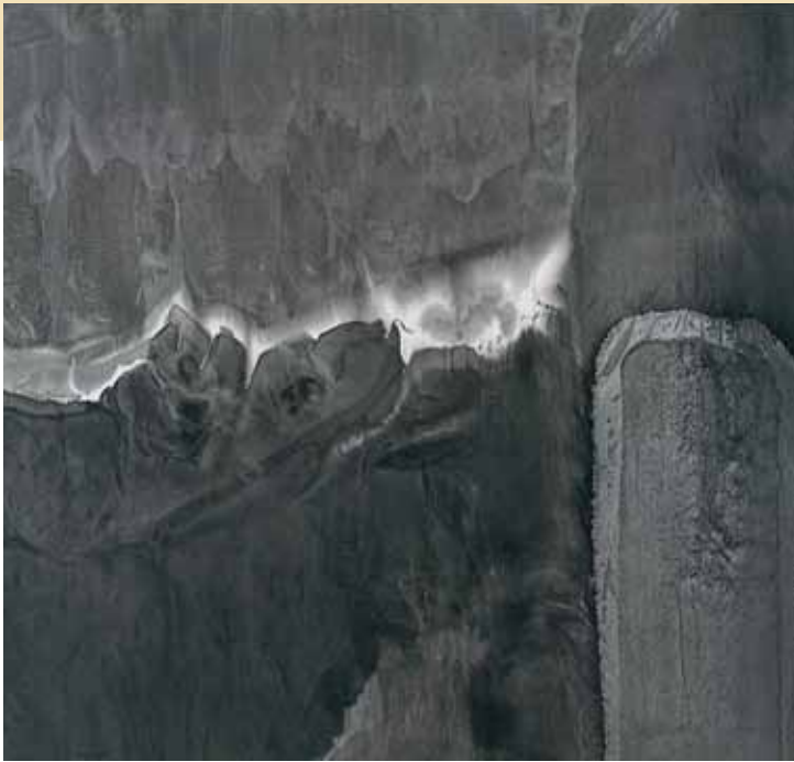
Gao Xingjian: La Mémoire Perdue (2003), Tusche auf Reispapier